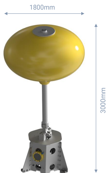
Convertitore di energia ondosa